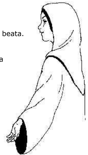
UN OCCHIO A MARIA, donna dell'avvento

L'anima mia magnifica il Signore e il mio spirito esulta in Dio, mio salvatore, perché ha guardato l'umiltà della sua serva. D'ora in poi tutte le generazioni mi chiameranno beata. Grandi cose ha fatto in me l'Onnipotente e Santo è il suo nome: di generazione in generazione la sua misericordia si stende su quelli che lo temono. Ha spiegato la potenza del suo braccio, ha disperso i superbi nei pensieri del loro cuore; ha rovesciato i potenti dai troni, ha innalzato gli umili; ha ricolmato di beni gli affamati, ha rimandato i ricchi a mani vuote. Ha soccorso Israele, suo servo, ricordandosi della sua misericordia, come aveva promesso ai nostri padri, ad Abramo e alla sua discendenza per sempre.