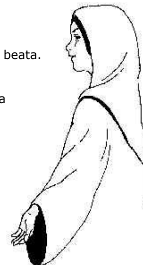
UN OCCHIO A MARIA, donna dell'avvento

L'anima mia magnifica il Signore e il mio spirito esulta in Dio, mio salvatore, perché ha guardato l'umiltà della sua serva. D'ora in poi tutte le generazioni mi chiameranno beata. Grandi cose ha fatto in me l'Onnipotente e Santo è il suo nome: di generazione in generazione la sua misericordia si stende su quelli che lo temono. Ha spiegato la potenza del suo braccio, ha disperso i superbi nei pensieri del loro cuore; ha rovesciato i potenti dai troni, ha innalzato gli umili; ha ricolmato di beni gli affamati, ha rimandato i ricchi a mani vuote. Ha soccorso Israele, suo servo, ricordandosi della sua misericordia, come aveva promesso ai nostri padri, ad Abramo e alla sua discendenza per sempre.